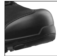
HAIX® Composite Toe Cap