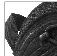
HAIX® Climate System