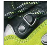
HAIX® 2-Zone Lacing