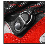
HAIX® 2-Zone Lacing