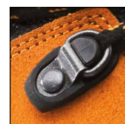
HAIX® 2-Zone Lacing