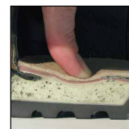
HAIX® MSL System