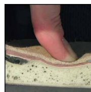
HAIX® MSL System