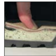
HAIX® MSL System